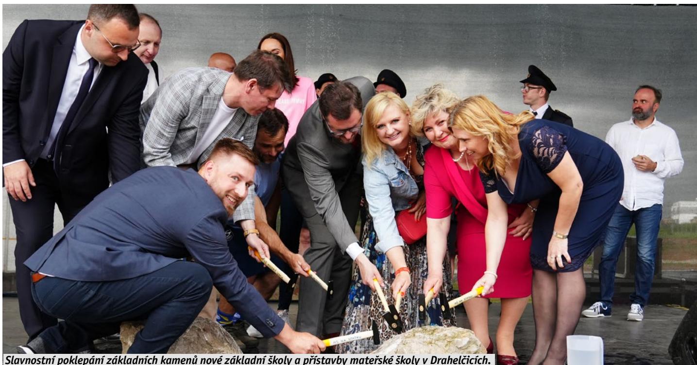
Slavnostní poklepání základních kamenů nové základní školy a přístavby mateřské školy v Drahelčicích.