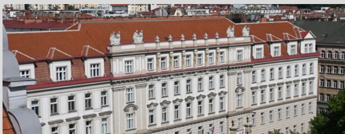
Zastupitelstvo zasedalo 27. května 2024

„Na žádosti o návratnou finanční výpomoc bude vyčleněno 20 milionů Kč, přičemž maximální výše žádosti činí 4 miliony korun. Malé obce do 3 000 obyvatel budou moci žádat od 1. července 2024 do 13. prosince 2024 prostřednictvím aplikace eDotace, a to na předfinancování projektu spolufinancovaného z fondů EU/EHP nebo z národních zdrojů,“ upřesnil náměstek hejtmanky pro oblast financí a dotací Michael Kašpar.