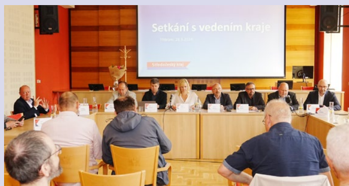
Debata s vámi, občany našeho kraje, nesmí chybět.