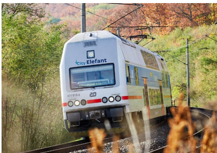
Tento typ vlaků hodlá kraj vyměnit za nové modernější.

Středočeský kraj ve spolupráci s Hlavním městem Prahou představily parametry celé soutěže na nedávném kulatém stole s novináři. Další podrobnosti najdete na krajském webu ZDE .