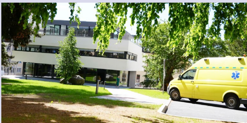
Benešovská nemocnice v novém.