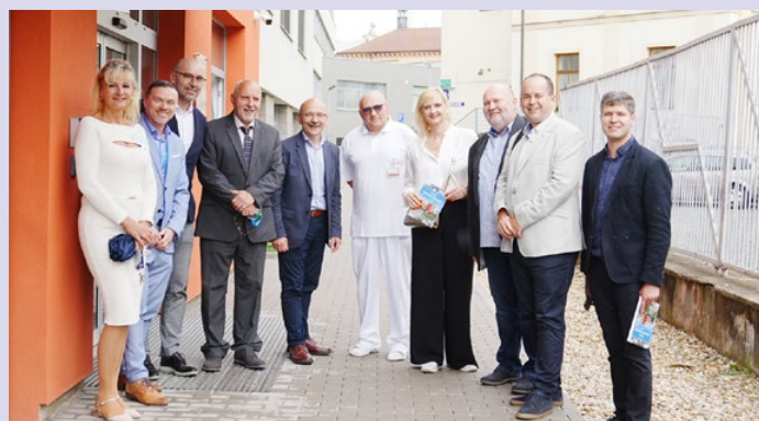
Návštěva příbramské nemocnice.

Vedení Středočeského kraje pravidelně jezdí do regionu a navštěvuje místní školy, firmy, zdravotní a sociální zařízení nebo kulturní