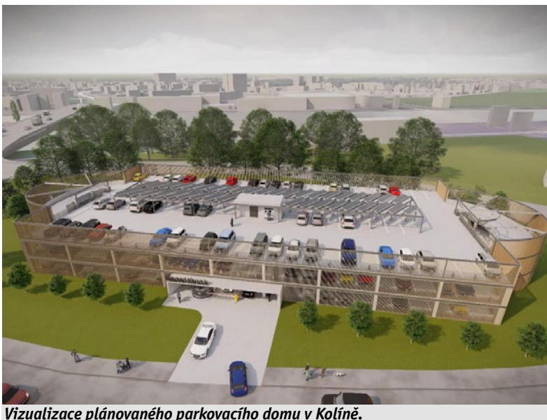
Vizualizace plánovaného parkovacího domu v Kolíně.

Středočeský kraj bude při budování parkovišť P+R v Kolíně a Nymburku úzce spolupracovat s městy.