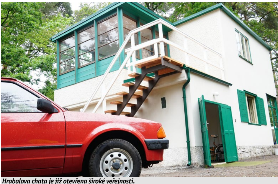
Hrabalova chata je již otevřena široké veřejnosti.